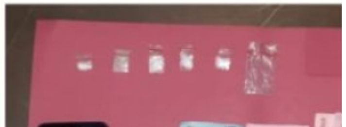
Pelaku narkoba beserta barang bukti yang diamankan Satreskoba Polres Kuansing Riau